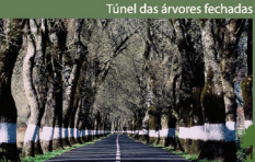
Túnel das árvores fechadas