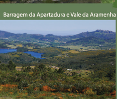
Barragem da Apartadura e Vale da Aramenha