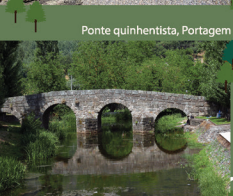
Ponte quinhentista, Portagem