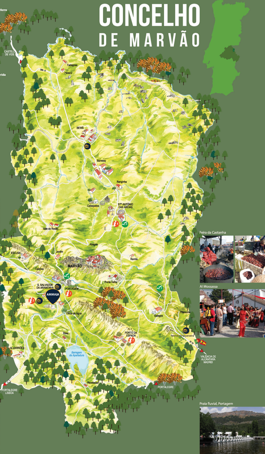
Feira da Castanha