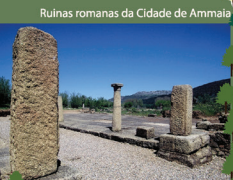
Ruínas romanas da Cidade de Ammaia