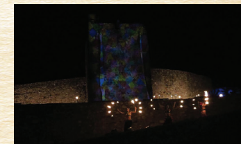
A FESTA DAS TRÊS CULTURAS MARVÃO 10 000 ANOS DE VIDA sábado 21H30