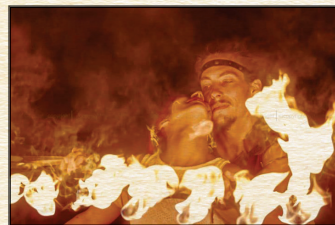
SOM, LUZ... FOGO sexta-feira 21H30